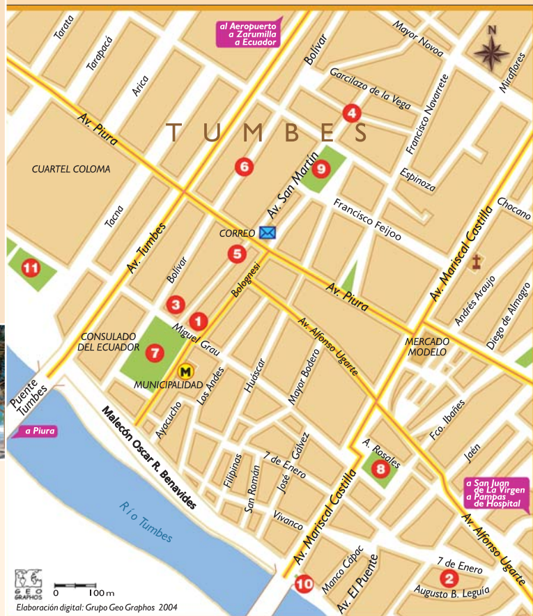
Elaboración digital: Grupo Geo Graphos 2004

A lo largo del litoral existen también extensas playas de arena blanca y aguas cálidas, con temperaturas propias de los mares tropicales, que alcanzan hasta los 25°C (77°F). El sol brilla durante todo el año y la variedad de actividades que se ofrecen ha convertido la zona en un lugar sumamente cotizado y visitado. La temperatura media anual máxima es de 26°C (79°F) y la mínima de 19°C (66°F). Sin embargo, el clima cambia drásticamente cuando se presenta el fenómeno de El Niño, que ocasiona mayores precipitaciones y elevadas temperaturas que pueden sobrepasar los 40°C (104°F).