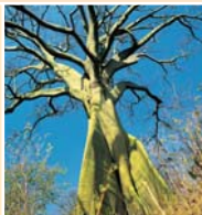
Ceibos en Cerros de Amotape