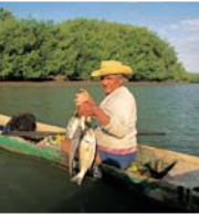
◀ Manglares de Tumbes

Se trata de un mirador construido sobre la colina más alta de la ciudad, a sólo cinco minutos en auto, desde donde es posible observar buena parte de la geografía de la zona. El mirador se encuentra dentro de un Área Natural Privada llamada Palo Santo, con bosques compuestos por especies típicas de la región como algarrobos, palo santo, hualtacos y charanes. El lugar es hábitat de más de 30 especies de aves, muchas de ellas endémicas de la región tumbesina, y se han creado diversos senderos para poder observar la flora y la fauna de la región. Puede ser visitado todo el año.