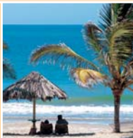
Playa Punta Sal